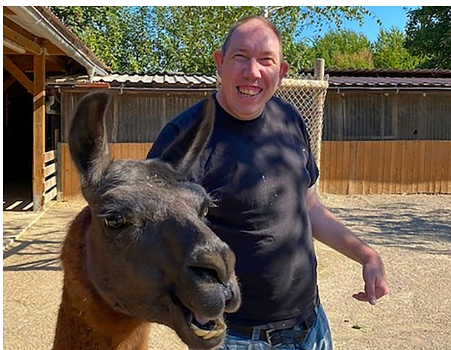
Die Freude ist beiderseits.

Das Projekt „Aktiv im Streichelzoo“ existiert allein durch finanzielle Unterstützung von außen. Die CaritasStiftung ermöglichte den Start und die ersten Monate der Initiative. Doch das Projekt ist weiterhin auf Förderung angewiesen. Die CaritasStiftung förderte das Projekt „Aktiv im Streichelzoo“ mit 10.000 Euro.